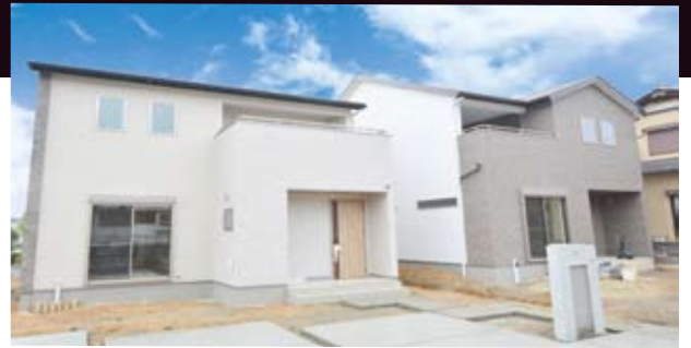
※掲載の写真は2017年6月に撮影したものです。

7/1 SAT → 7月下旬(土・日・祝開催) ※来場者プレゼントは商品がなくなり次第終了致します。